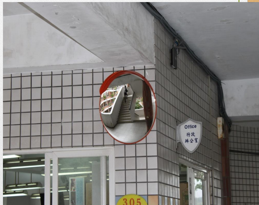
轉角加裝反射鏡減少碰撞意外傷害