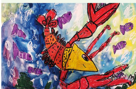
104 盧宥辰 深海龍蝦大王