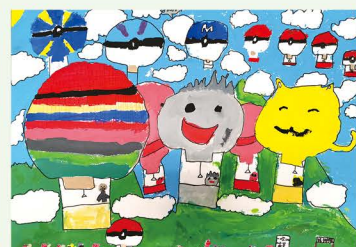
506 強愷恩 熱氣球