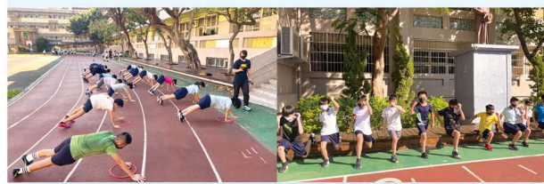
田徑隊體能訓練花絮