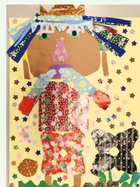
406 郭芳妘 逛花園