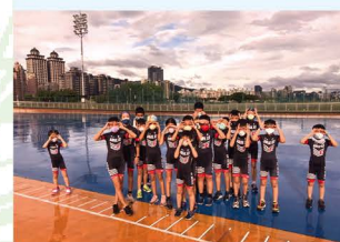
直排輪 校隊練習 花絮