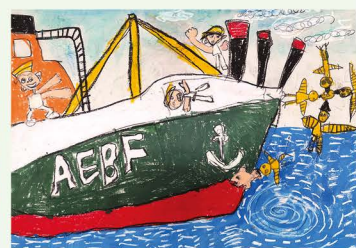
305 謝昇峰 大輪船