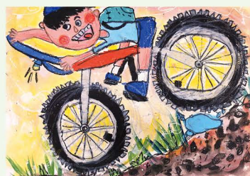
305 黃奕學 騎腳踏車