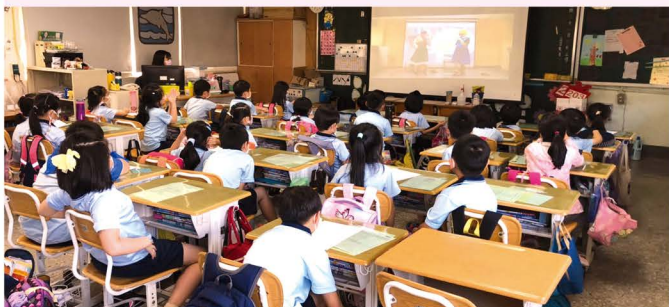
二年級性平家暴防治 戲劇宣導活動