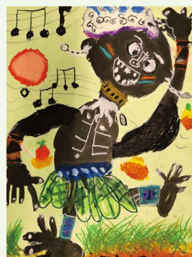
206 黃奕維 小黑人