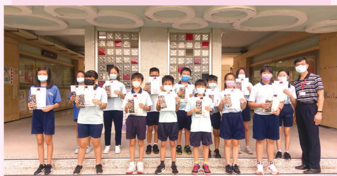
謝謝六年級新生服務隊開學一個月來的付出