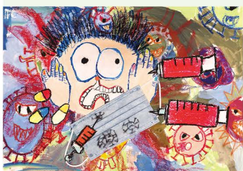
205 林杰弘 病毒來了快快跑