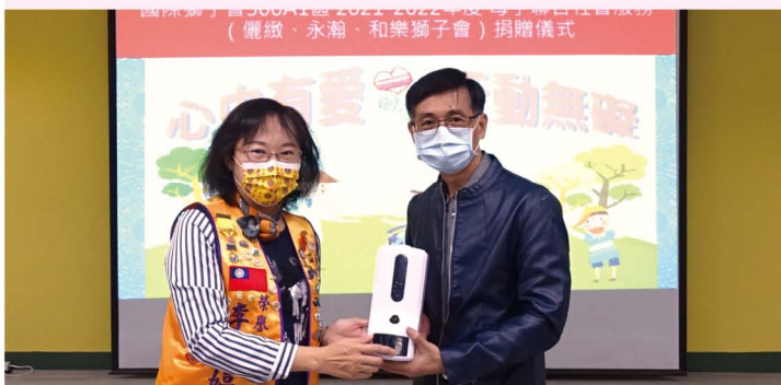
心中有愛行動無礙 儷緻、永瀚、和樂獅子會捐贈儀式