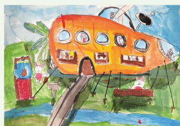
502 莊育愷 搭蘿蔔船旅遊