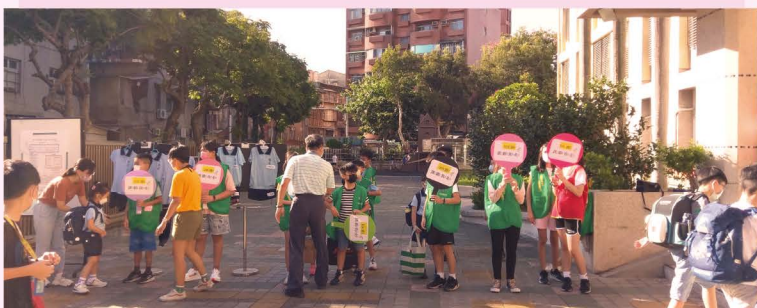
六年級新生服務隊 開學迎新有大大哥哥姊姊帶領真安心！