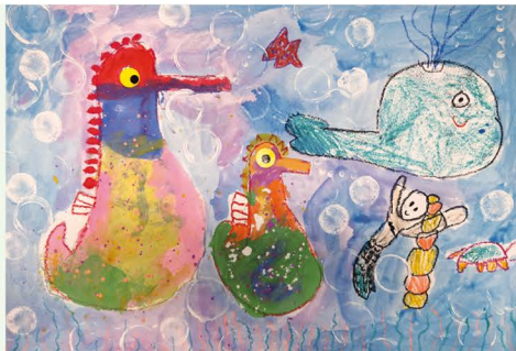
106 葉庭瑜 海底世界