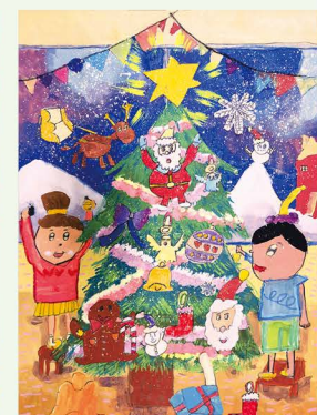
506 陳家姿 迎接耶誕繽紛的冬