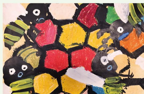
107 陳楷杰 小蜜蜂 嗡嗡嗡！