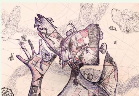
604 廖致凱 我和魚