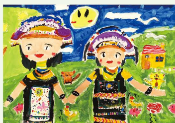
302 顏翌庭 原住民