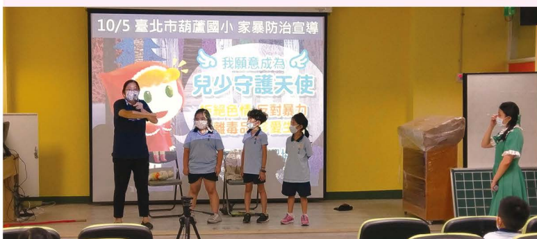
純潔協會的講師們用灰姑娘戲劇方式演出教導我們拒絕家庭暴力