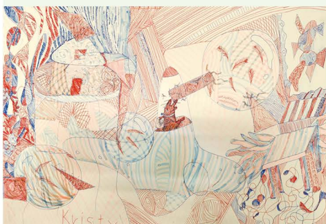
601 陳可庭 蔓