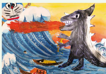
407 蔡妍樺 小哆噹大戰哥吉拉