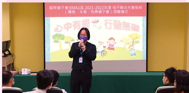
心中有愛行動無礙 儷緻、永瀚、和樂獅子會捐贈儀式