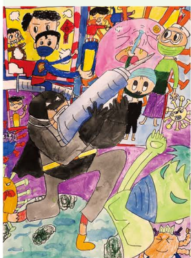
202 許碩恩 防疫大作戰