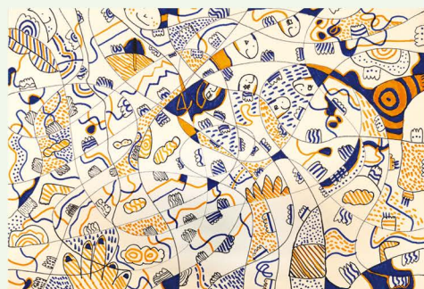
604 徐曉陽 無題