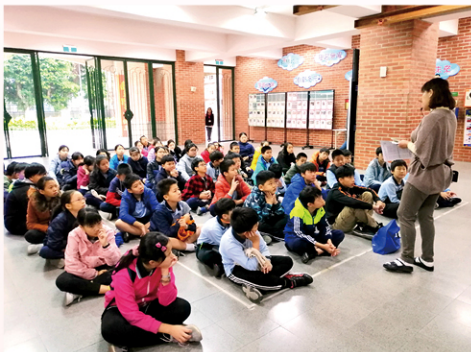
蓬萊國小的英語情境中心，不同的教學體驗，留下深刻的記憶。