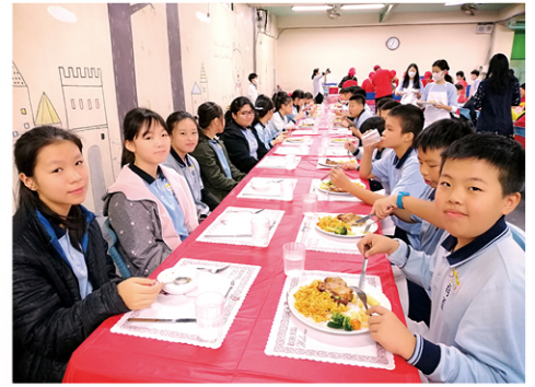
淑女與紳士們的午餐約會，學習西餐禮儀優雅的氛圍。