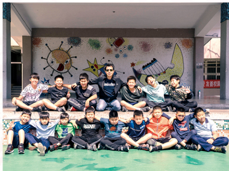
兩年共處的時光有著「五」味雜陳的欣喜(歡笑)與感動(淚水)，讓我們不分彼此一起手牽手、心連心，互道珍重再見。