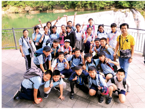
十分瀑布有如萬馬奔騰傾瀉而下，氣勢宏偉壯觀，全班在瀑布前合影留念。