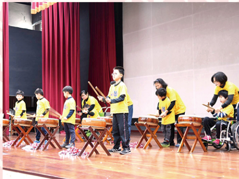
台上三分鐘，台下十年功！瞧我們大顯身手歲末耶誕傳溫馨！