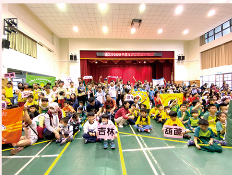
拿冠軍！拿金牌！！臺北市國小特教盃地板滾球大賽分組第二名！！