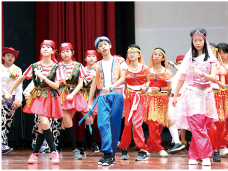
五年級成果發表會—辛巴達航海記，全班盡情演出，展現活力與舞技。