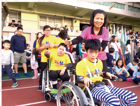
校慶體育表演運動會，通力合作完成趣味競賽！