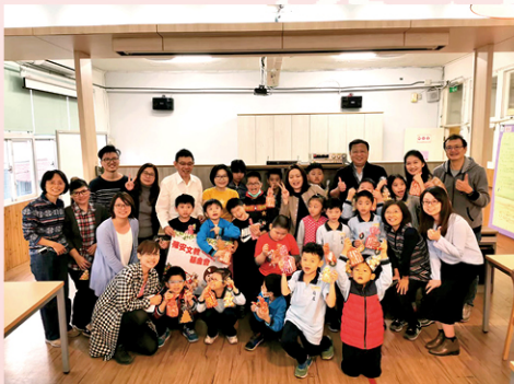
陳安文教基金會 彩繪糖霜薑餅好吃又好玩！