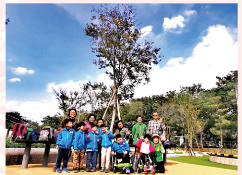
華山大草原共融遊具好好玩！下次還要來:D