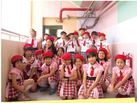
成發--我的少女時代