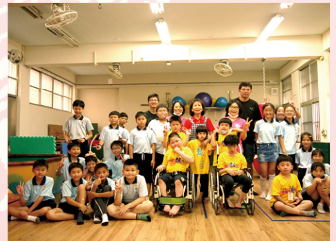
與503地板滾球友誼賽，把握與同學相處的每一刻，創造歡樂回憶！