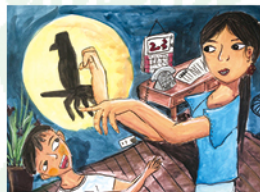
607 陳亮瑾 影子