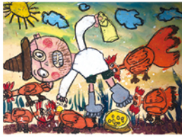
104 洪浚曦 養雞人家