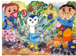
401 陳家姿 遇見幸福