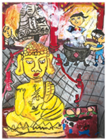
307 吳丞諺 拜拜