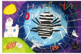
201 連品真 織網高手的萬聖節派對