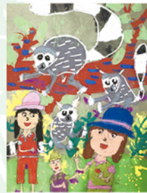
304 鄭郁堯 環尾狐猴