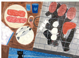
606 洪嫻茹 烤肉