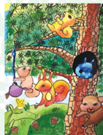
405 林禹彤 小松鼠