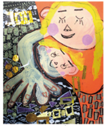
204 王政頤 媽媽，抱一下