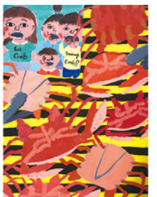
603 沈心柔 吃螃蟹