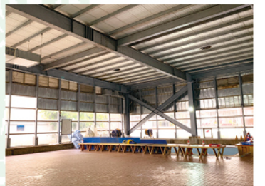
游泳池室內鋼構防鏽