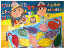
405 李佳耘 打毛線