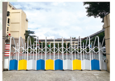
環北校門修繕更新