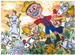
205 黃奕維 餵雞