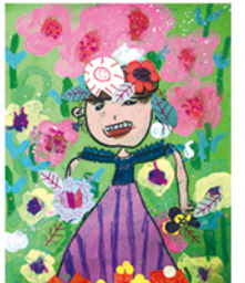
206 鄭琬霏 花神來了