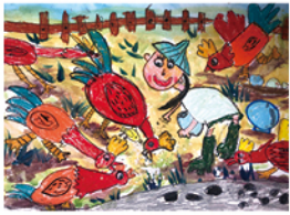
104 余芷維 養雞人家