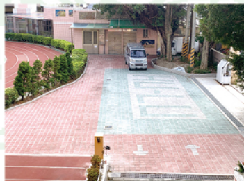
環北校門地坪修繕更新