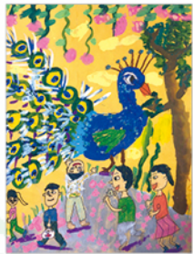
305 廖奕澄 孔雀園