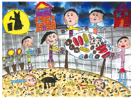
306 邱子霽 我的中秋節