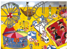
601 林宸卉 遊樂園