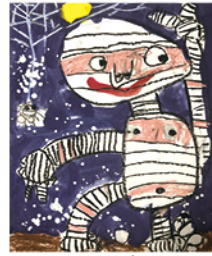
106 黃奕維 神秘木乃伊